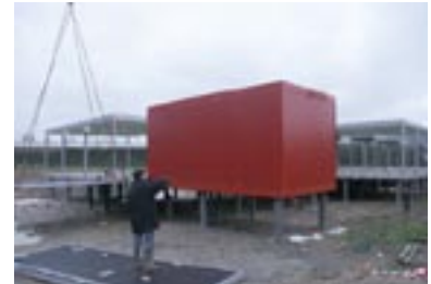
L'assemblage des modules s'effectue en trois jours