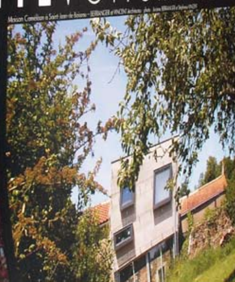
Maison Corbellan à Saint-Jean-de-Braye - HERVÉ et VINCENT architectes