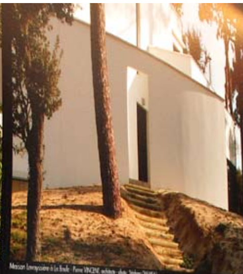
Maison Lemprière à La Roche - Pierre VINCZE architecte