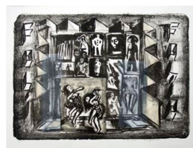
Éric Fonteneau, 2006