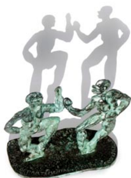
Francine Toulemonde, 2002

sculptures de Francine Toulemonde, en 2004, des sculptures et des sérigraphies d'Alain Douillard, et en 2006 des sérigraphies de Éric Fonteneau.